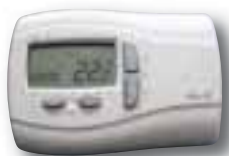
Boîtier de commande ELIW pour ROOF-TOP