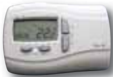
Boîtier de commande ELIW